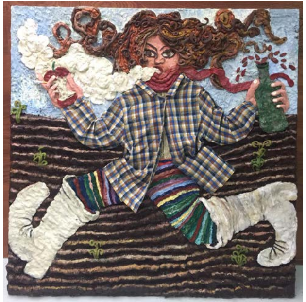
Sietske Van Aerde, Vagabond , 2021

Sinds 2019 focust Van Aerde vooral op de schilderkunst. Haar schilderijen toonde ze voor het eerst in de groepstentoonstelling Een blik achter de muur in Hoboken (2020) en in de context van The Wunderwall bij galerij PLUS ONE & Sofie Van de Velde.