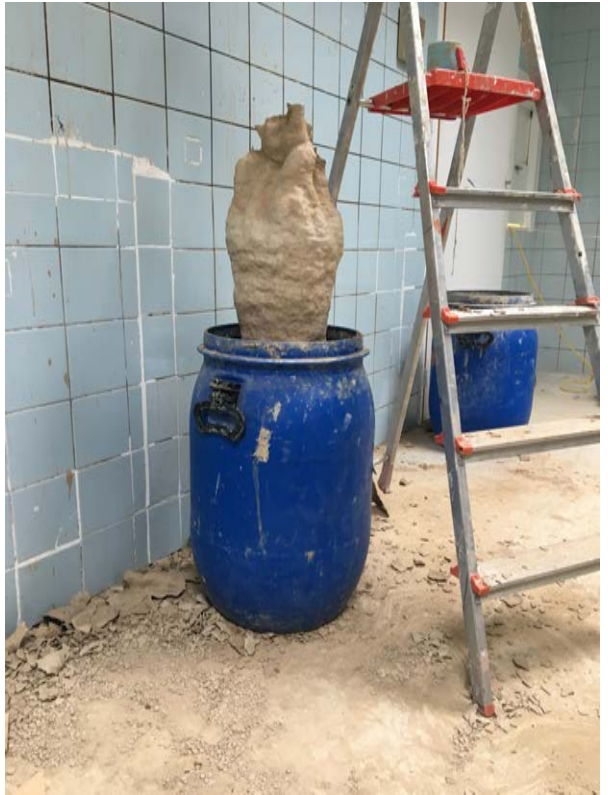
Chris Hoeben, werk in opbouw , 2021 PVC en klei Keuken LLS Paleis

om tijdens NowBelgiumNow eerder een fragiel werkproces dan een sculptuur die de tand des tijds doorstaat, tentoon te stellen.